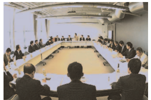
建設トップランナーフォーラム会議風景

平成18年には、「建設トップランナーフォーラム」を立ち上げ、新分野進出や地域活性化に挑戦する建設業者の支援を行っている。