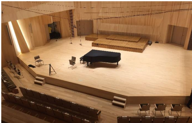
音大の教育施設として、フルオーケストラが使える広めのステージ