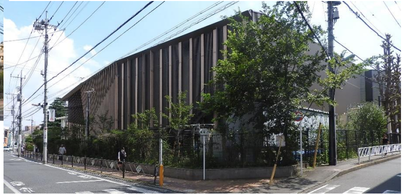
道路面の建物意匠