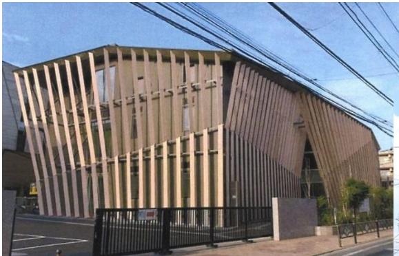
エントランス面の建物意匠