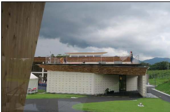
③ ビジターセンター・ショップ