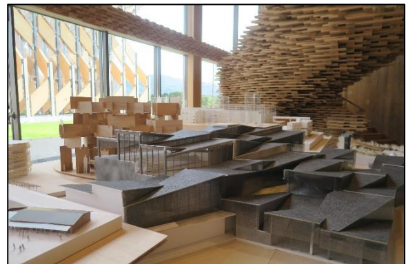
② 蒜山ミュージアム