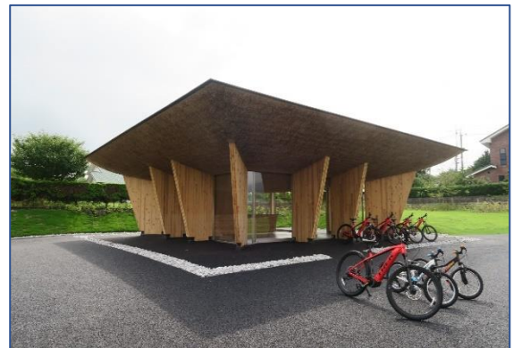
④ サイクリングセンター