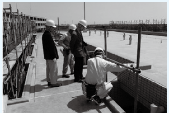
建設現場監理支援