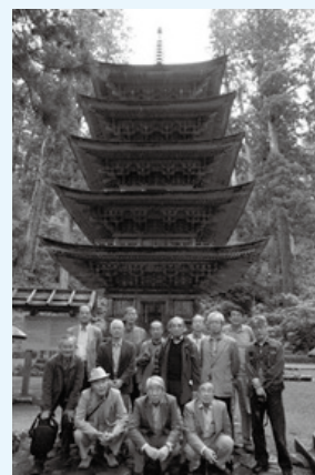
歴史的建築物探訪