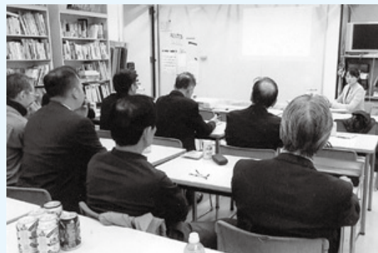
サーツ寺子屋 講座