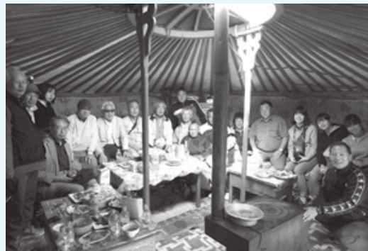
モンゴル技術支援ゲル訪問