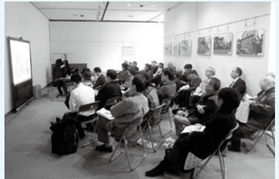
耐震フェアでのセミナー