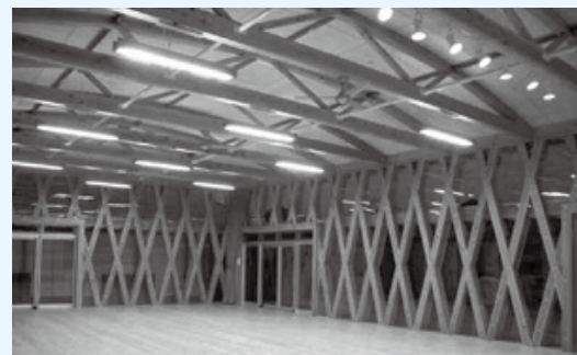
大型木質構造 建築設計Web セミナー資料